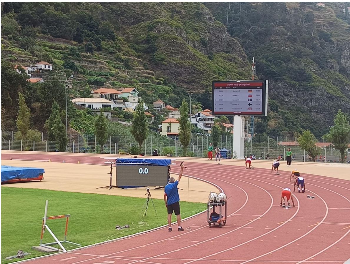
Pantalla gegant del Estadi (operativa a partir del 5è dia)