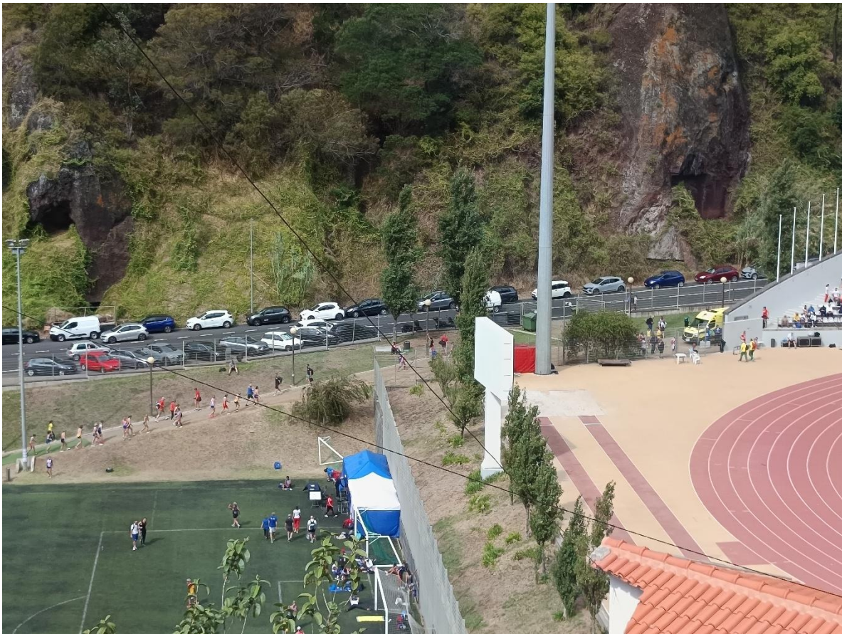
Call-Room amb la respectiva rampa d'accés al Estadi. Al fons, carretera amb cotxes a la vorera