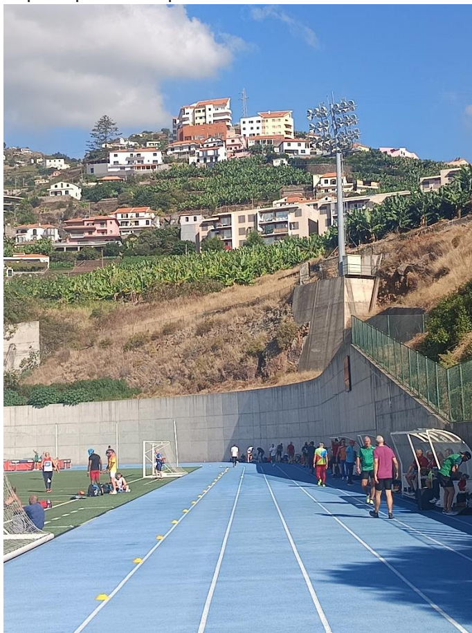
Contra recta de les pistes de Câmara de Lobos