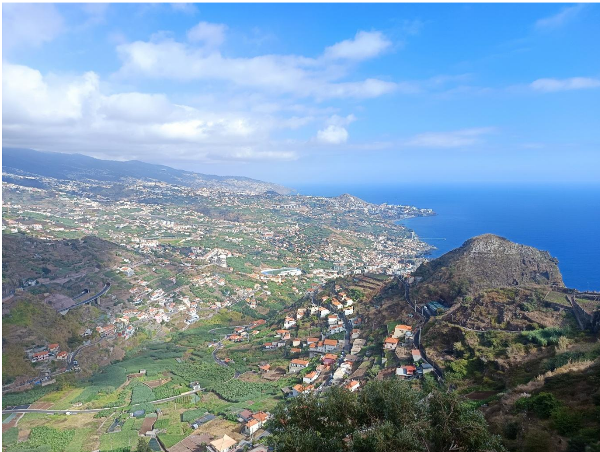
Vista panoràmica de Madeira amb les pistes d'atletisme de Câmara de Lobos al mig.