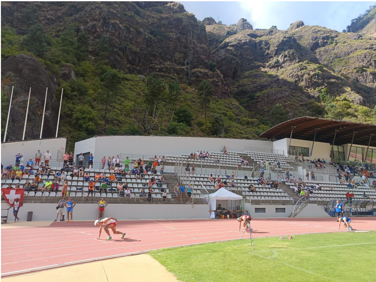
Estadi "Centro Desportivo da Madeira". Situat a 22 kms de la capital, Funchal