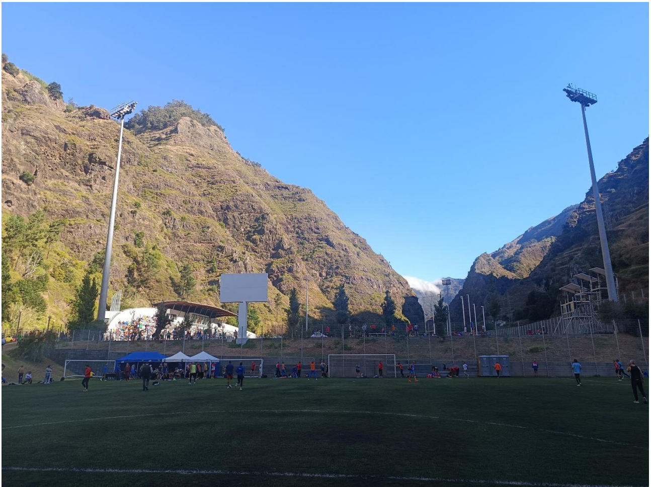
Zona d'escalfament. Al fons, Call-Room. Per sobre el nivell, "Centro Desportivo da Madeira"