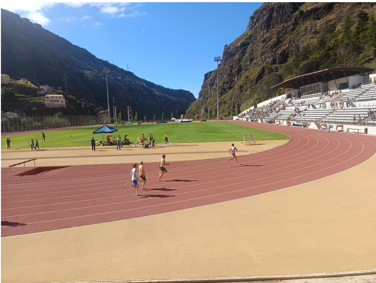
Estadi "Centro Desportivo da Madeira". Enclavat en un pla en mig de les muntanyes.