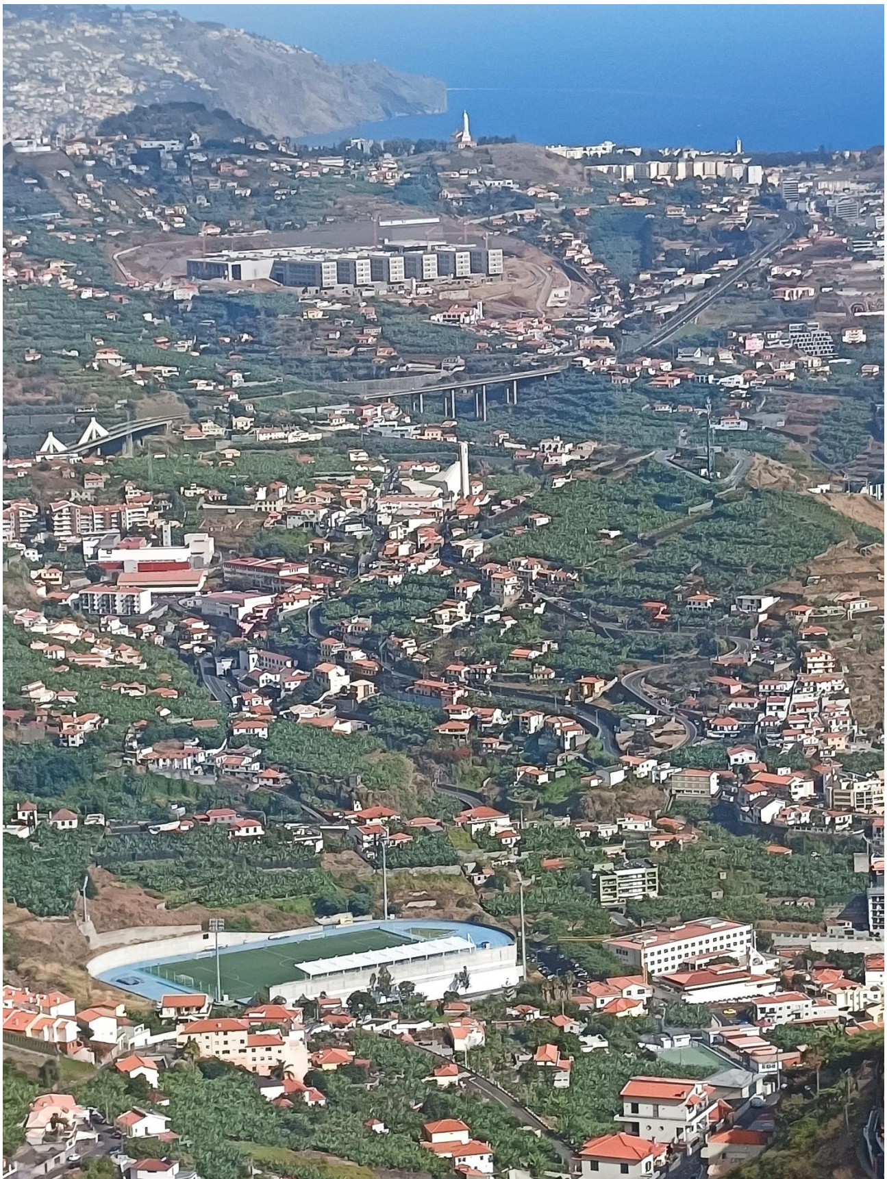
Pistas d'Atletisme Câmara de Lobos. Al fons, Funchal (14 kms)