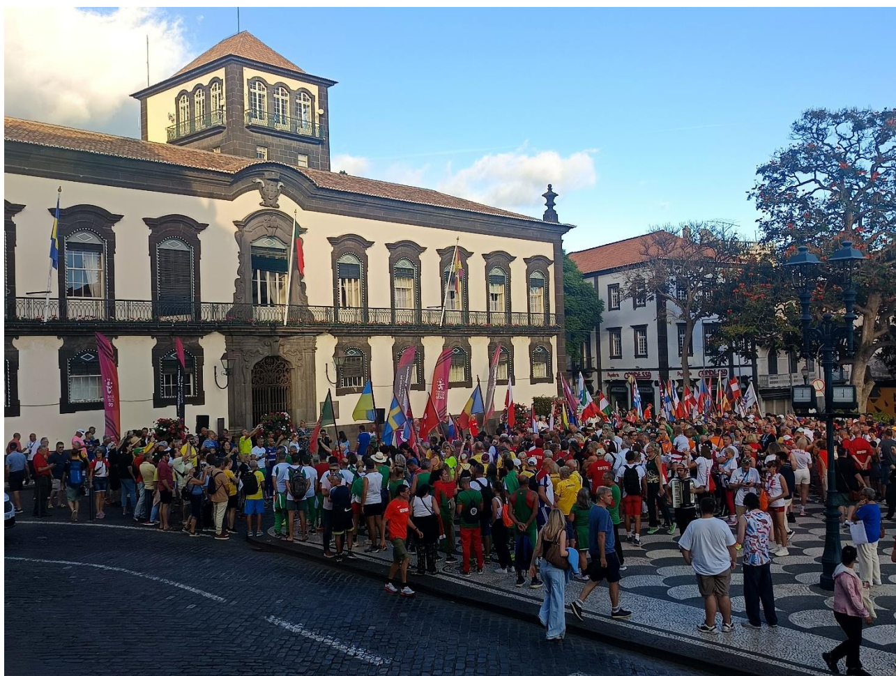
Desfilada inaugural dels països participants davant Ajuntament (Praca do Municipio)