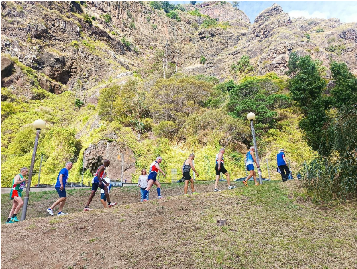
Aletes seguint al jutge per la rampa que comunica la Call-Room amb l'Estadi.