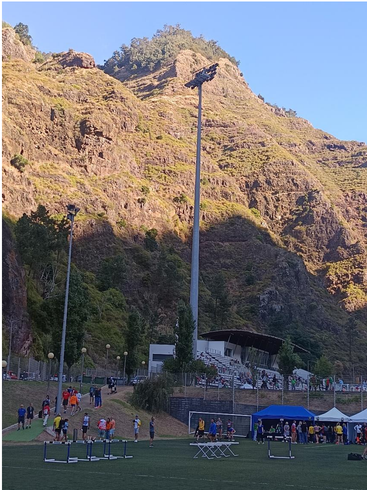
Call-Room amb la respectiva rampa d'accés al Estadi. Idíl·lic : a peu de muntanya.