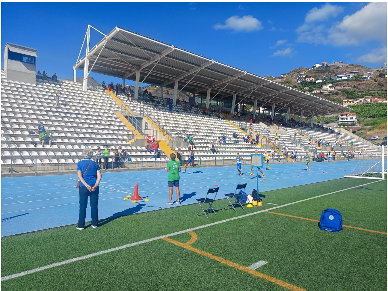
Recta principal de les pistes de Câmara de Lobos