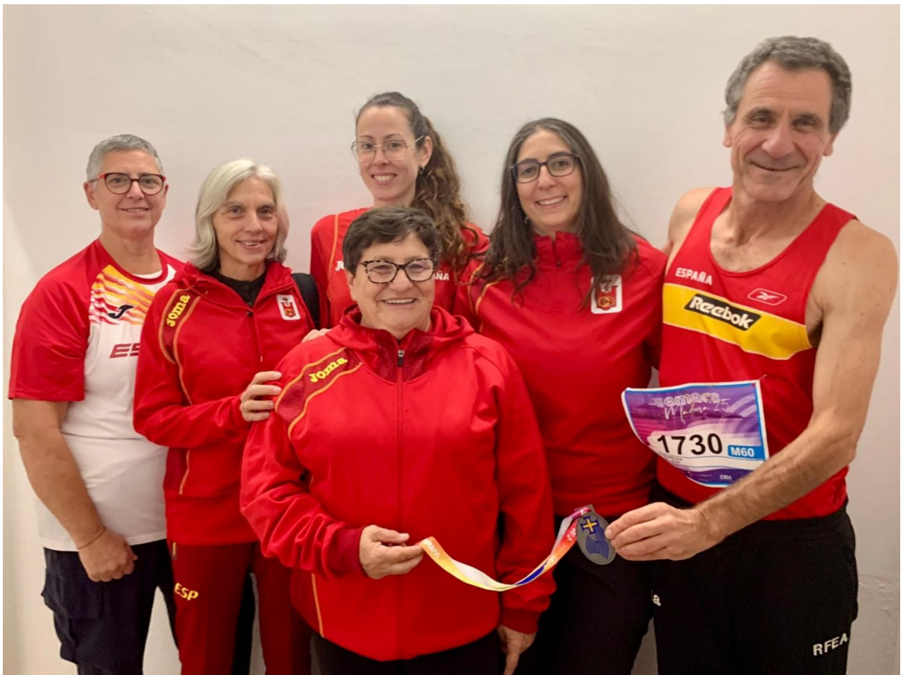
Els 6 atletes de la JAS participants a Madeira