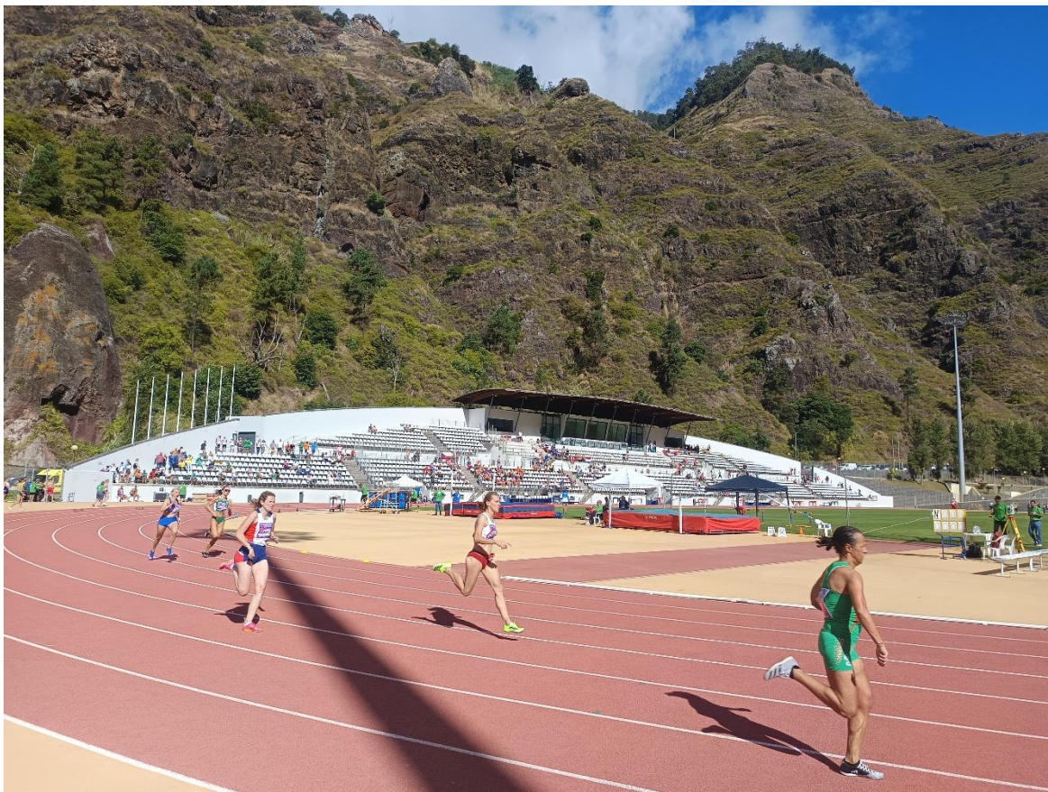
Estadi "Centro Desportivo da Madeira". Estadi principal del Campionat.