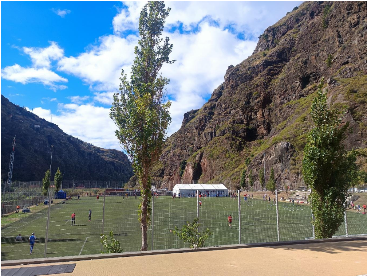
Zona d'escalfament. Al fons, carpa recollida dorsals.