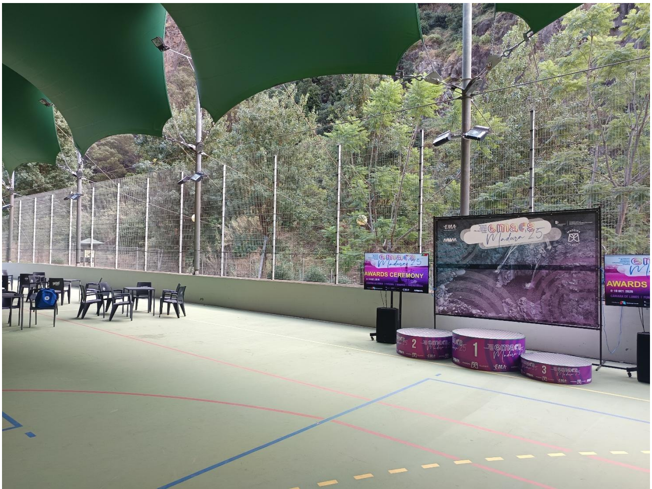
/ "Medal Plaza". Cerimònia premiació i servei de menjador compartint mateix escenari.