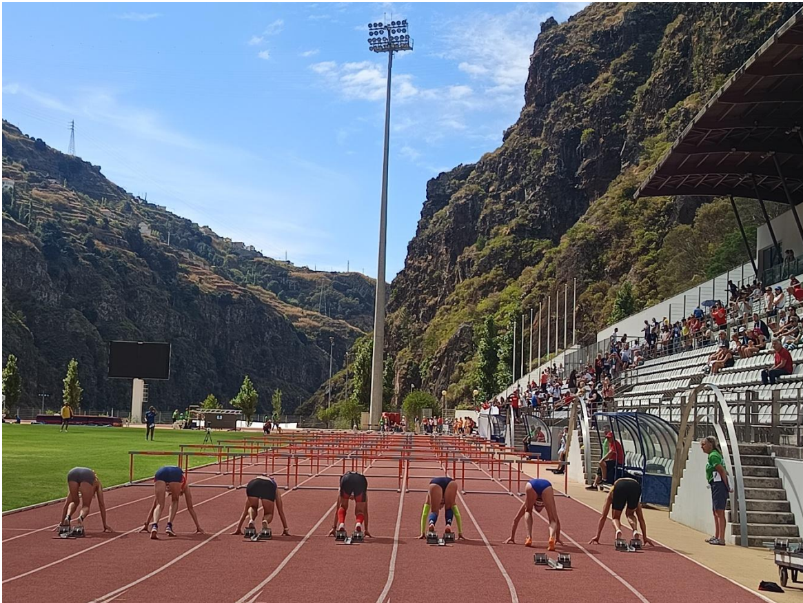
Pantalla gegant del Estadi (inoperativa els primers 4 dies)